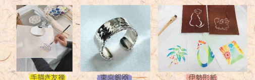
手描き文様 東京銀絡 伊勢形紙

伝統産業職人会は様々な伝統工芸品の体験教室を開催しています。体験教室に関する詳細は、随時、公式サイトやInstagramなどでお知らせします。*写真裏は過去の体験教室の例